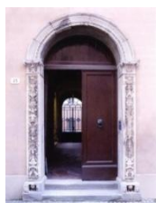
Istituto storico della resistenza e dell'età contemporanea in Forlì e Cesena