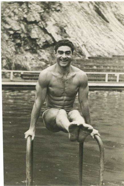
Alfred Nakache (Artem) in una piscina. Francia, anni 1950-1960.

Nel 1946, meno di un anno dopo la sua liberazione a Buchenwald, Alfred Nakache batte un altro record del mondo nella staffetta 3 x 100 metri mista, due anni più tardi partecipa alle Olimpiadi di Londra (da cui la Germania è esclusa) dove gareggia per il nuoto a farfalla e nella squadra di pallanuoto.